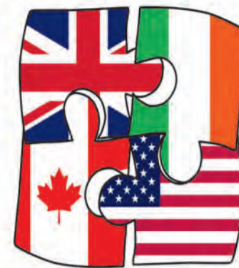
KOLO NAUKOWE ANGLISTOW

Either way, we wish you time to truly stop, take a real deep breath, engage yourself in some meaningful activity or turn into a pancake frying your body on the beach. Take a pick! More importantly, find some time for true self. And maybe, once you have recharged your batteries, take a look around, as somewhere out there, there is a person struggling with depression - soul's cancer. Reach out.