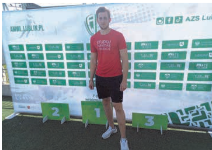
runku turystyka i rekreacja w Akademii Zamojskiej. DR

Studenci Akademii Zamojskiej wywalczyli srebrny medal i tytuł Akademickich Wicemistrzów Polski w tenisie stołowym!