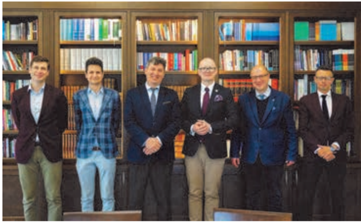
ona organizowanie sympozjów i przedsięwzięć naukowych oraz

stworzenie klastra uczelni międzynarodowych, które mogłyby współdziałać przy wsparciu funduszy Unii Europejskiej i byłyby zainteresowane upowszechnianiem klasycznego modelu uniwersytetu. Modelu, gdzie uniwersytet jest ukierunkowany na tworzenie wspólnoty akademickiej, integralnie zrosniętej z narodem, z potrzebami regionalnymi i krzewieniem klasycznej kultury. Fundamentem tej kultury jest antropologia personalistyczna, klasyczny rzymski model prawa oraz nauka. Rozmowy były poświęcone również przygotowaniu listu intencyjnego – powiedział Rek-