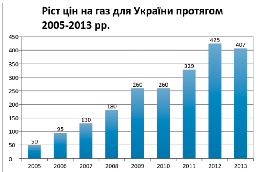
Рис. 1 Ріст цін на газ для України протягом 2005-2013 рр.

Проте ситуація значно змінилась після не підписання Президентом України Віктором Януковичем Угоди про Асоціацію з ЄС, після чого Російська Федерація знизила ціни на газ до 268,5 дол. За 1000 м. куб. та Уряд Росії прийняв рішення розмістити в цінних паперах українського Уряду частину своїх резервів з Фонду національного добробуту обсягом 15 млрд дол. 13