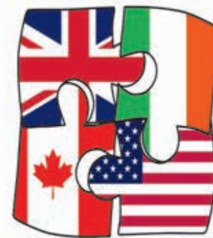
KOLO NAUKOWE ANGLISTÓW

We congratulate all, hoping that perhaps one day you'd love to develop your talent in our college, among students of English. And! to prove people do develop their talents here, here's a sample by one of our second-year students.