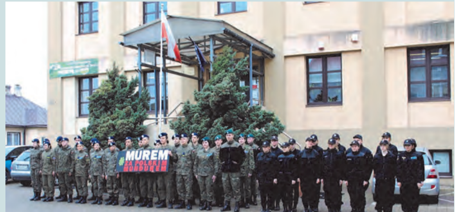
W akcję zamojskiej WKU włączyli się kadeci z „Mundurówki” (LOCSM Zamość)