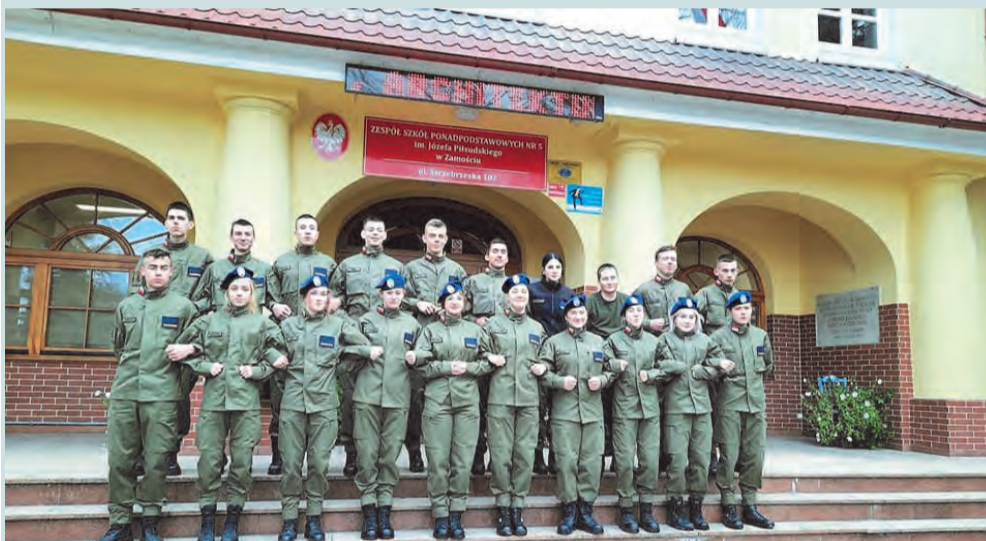
W akcji udział wzięli również uczniowie ZSP nr 5 im. Józefa Piłsudskiego w Zamościu