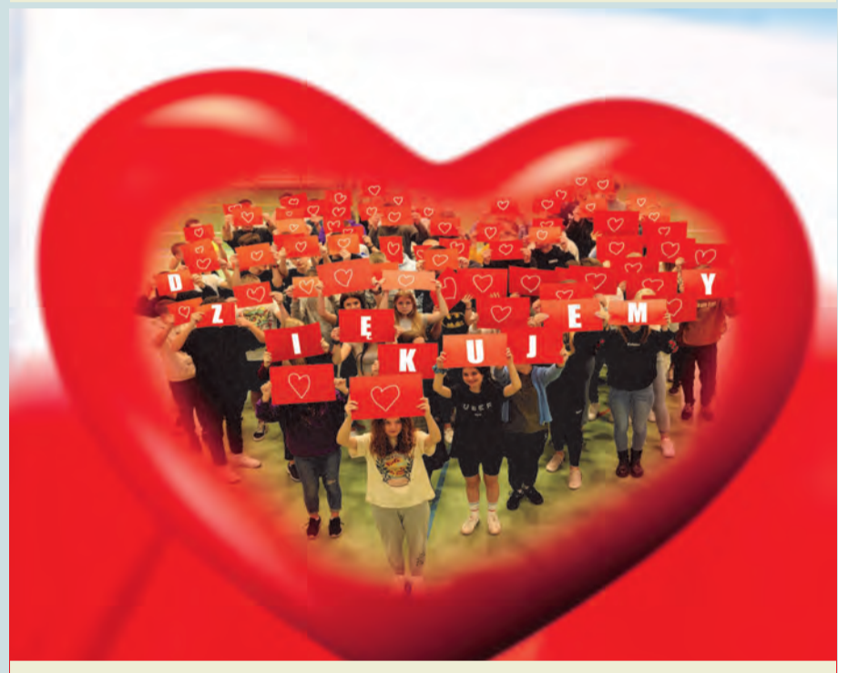
Happening #MuremZaPolskimMundurem w ZSP nr 3 w Zamościu („Elektryk”)