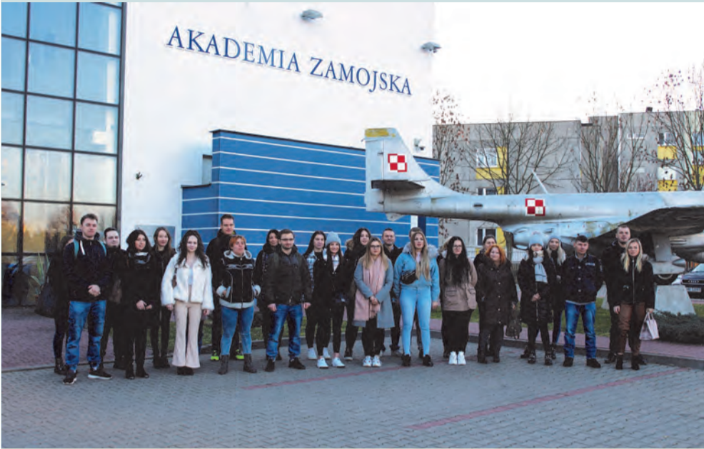
Studenci Akademii Zamojskiej wzięli udział w filmie przygotowanym przez WKU w Zamościu

Studenci Akademii Zamojskiej i młodzież ze szkół średnich z Zamojszczyzny włączyli się do akcji #MuremZaPolskimMundurem. Akcja jest formą wyrażenia wsparcia, wdzięczności i solidarności z żołnierzami Wojska Polskiego oraz funkcjonariuszami Policji i Straży Granicznej broniących granic kraju i strzegących bezpieczeństwa wszystkich Polaków. Studenci bezpieczeństwa narodowego AZ w ramach tej akcji wystąpili w filmie przygotowanym przez WKU w Zamościu, gdzie obok dzieci i młodzieży z Zamojszczyzny wyrazili swoje wsparcie i podziękowanie dla żołnierzy i służb mundurowych. W filmie wystąpiła również młodzież z LO CSM Zamość. Happeningi zorganizowali uczniowie ZSP nr 3 w Zamościu ("Elektryk") oraz ZSP nr 5 w Zamościu ("Rolniczak").