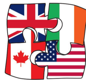
KOŁO NAUKOWE ANGLISTÓW

Marzę o spełnianiu się kreatywnie, ale również zawodowo. Po ukończeniu studiów chciałabym skończyć pracę nad jedną ze swoich książek oraz ją wydać. Po angielsku oczywiście. Chciałabym rozwijać się również jako fotograf, filmograf i montażysta, bo tego właśnie uczyłam się przez jakiś czas w Wielkiej Brytanii. Niedawno założyłam stronę fotograficzną, PassionAce Photography na Facebooku. Zawsze będę pamiętać również swoje praktyki w radiu RadioLab w Uniwersytecie Bedfordshire. Zdecydowanie chciałabym kiedyś znów