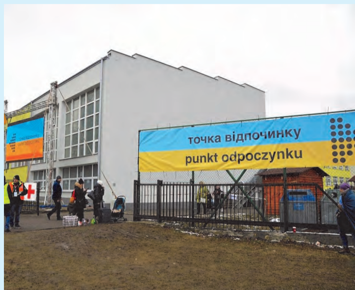
W zamojskim „Elektryku” działa punkt odпочынку. Ponadto w hali szkoły zorganizowano nocleg dla uchodźców; fot. Paweł Nowak, roztocze.net

zowaliśmy zbiórkę pieniędzy na potrzeby osób szukających schronienia w naszej Ojczyźnie przed wojną w Ukrainie. Społeczność I Liceum Ogólnokształcącego w Zamościu wykazała się podczas akcji dużą