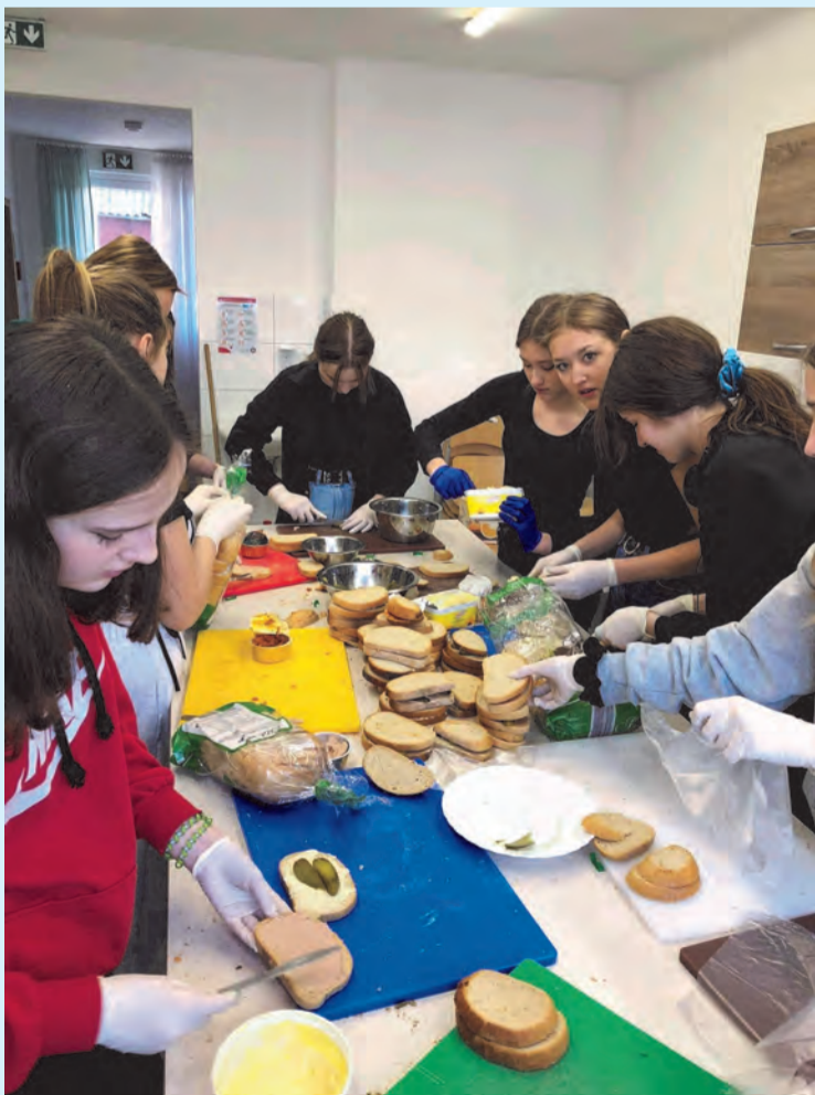
Młodzież z tomaszowskiej „Budowlanki” zaangażowała się w produkcję kanapek dla uchodźców

W działalność tę włączyła się także społeczność Akademii Zamojskiej. Pracownicy, absolwenci i studenci Uczelni zaangażowali się w pomoc na przejściach granicznych i w