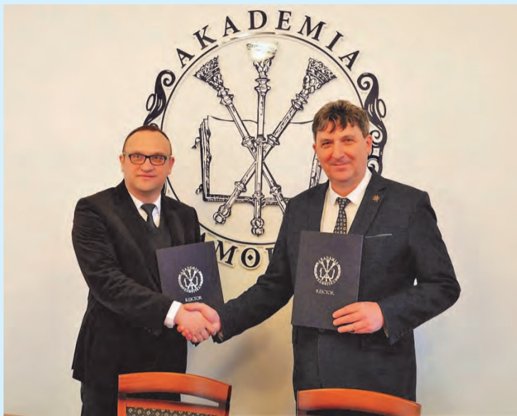
Uczelni powołanej przez wielkiego mecenasa kultury i nauki,

Akademia Zamojska, odwołując się do historycznej spuścizny