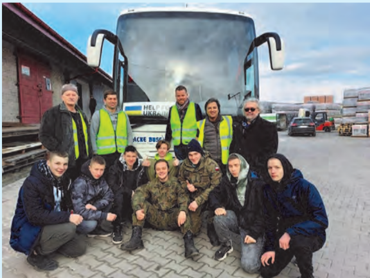
Ekipa z zamojskiej „Mundurówki” po rozładowaniu konwoju pomocy humanitarnej ze Szwecji; fot. J. Hereta „Tygodnik Zamojski”

punktach recepcyjnych, gdzie pomagają uchodźcom jako tłumacze i wolontariusze, m.in.. W punkcie znajdującym się w zamojskim „Elektryku”. Zakład Pielęgniarstwa AZ przeprowadził zbiórkę materiałów opatrunkowych oraz innych przedmiotów, potrzebnych w celu wsparcia punktów medycznych na granicy. Akademia Zamojska w miarę swoich możliwości udostępniła uchodźcom miejsca noclegowe. Ponadto Uczelnia udostępniła swój samochód do transportu osób lub towarów na