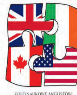
KOLO NAUKOWE ANGLISTÓW

We simply wanna announce the official beginning, whether of the second semester or spring waiting period, or a slide down towards summer vacation – choose your winner. Either way, we're slowly easing into each or all of these, therefore waiting for the results of our St Patrick competition, we are proud to present something for the heart and something for the pocket. Here are two pieces of writing created by our talented students. Enjoy and as always, watch this space.